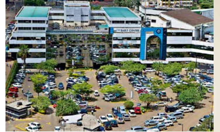
Afrika Kitası'nda Ticaretin Merkezi Kenya!

Bölgesel Ticaret Hub'ı: Kenya, bölgesel bir ticaret merkezi olarak işlev görmektedir. Komşu ülkelerle yapılan ticaret, Kenya'nın ekonomisine önemli bir katkı sağlamaktadır.